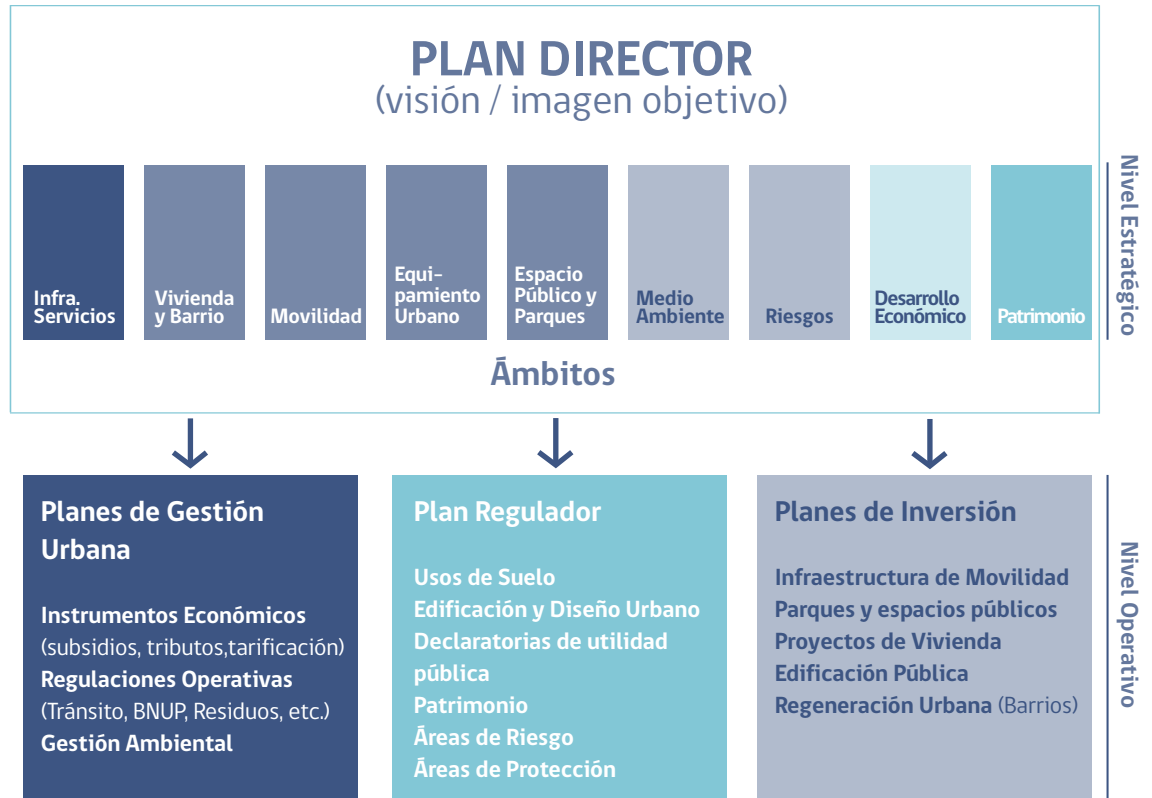
Figura 3: Esquema de Plan Director de Ciudad y su relación con planes operativos y seccionales 39